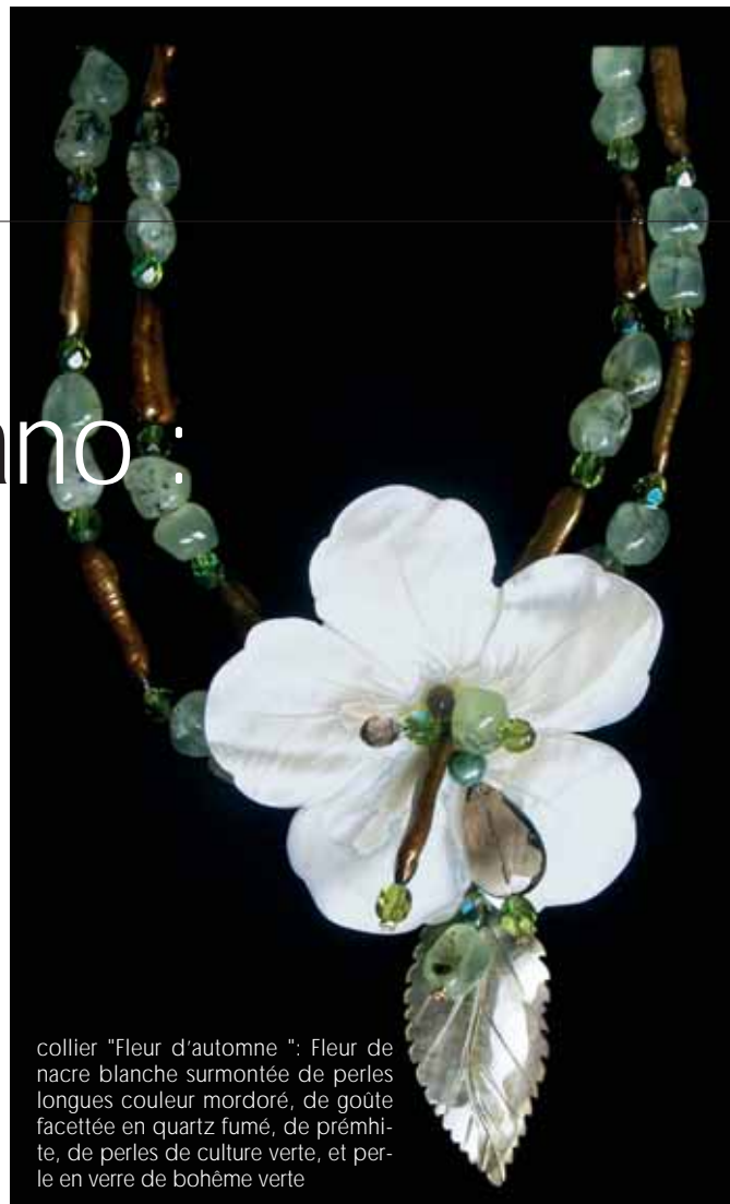
collier "Fleur d'automne" : Fleur de nacre blanche surmontée de perles longues couleur mordoré, de goutte facettée en quartz fumé, de prémière, de perles de culture verte, et perle en verre de bohème verte