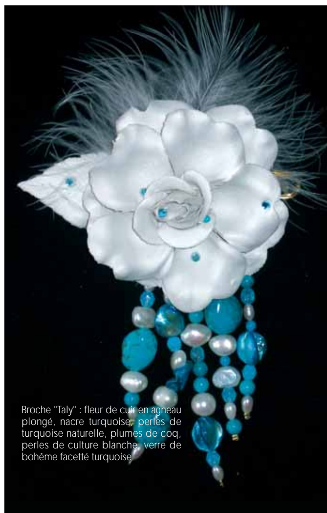
Broche "Taly" : fleur de cuir en agneau plongé, nacre turquoise, perles de turquoise naturelle, plumes de coq, perles de culture blanche, verre de bohème facetté turquoise