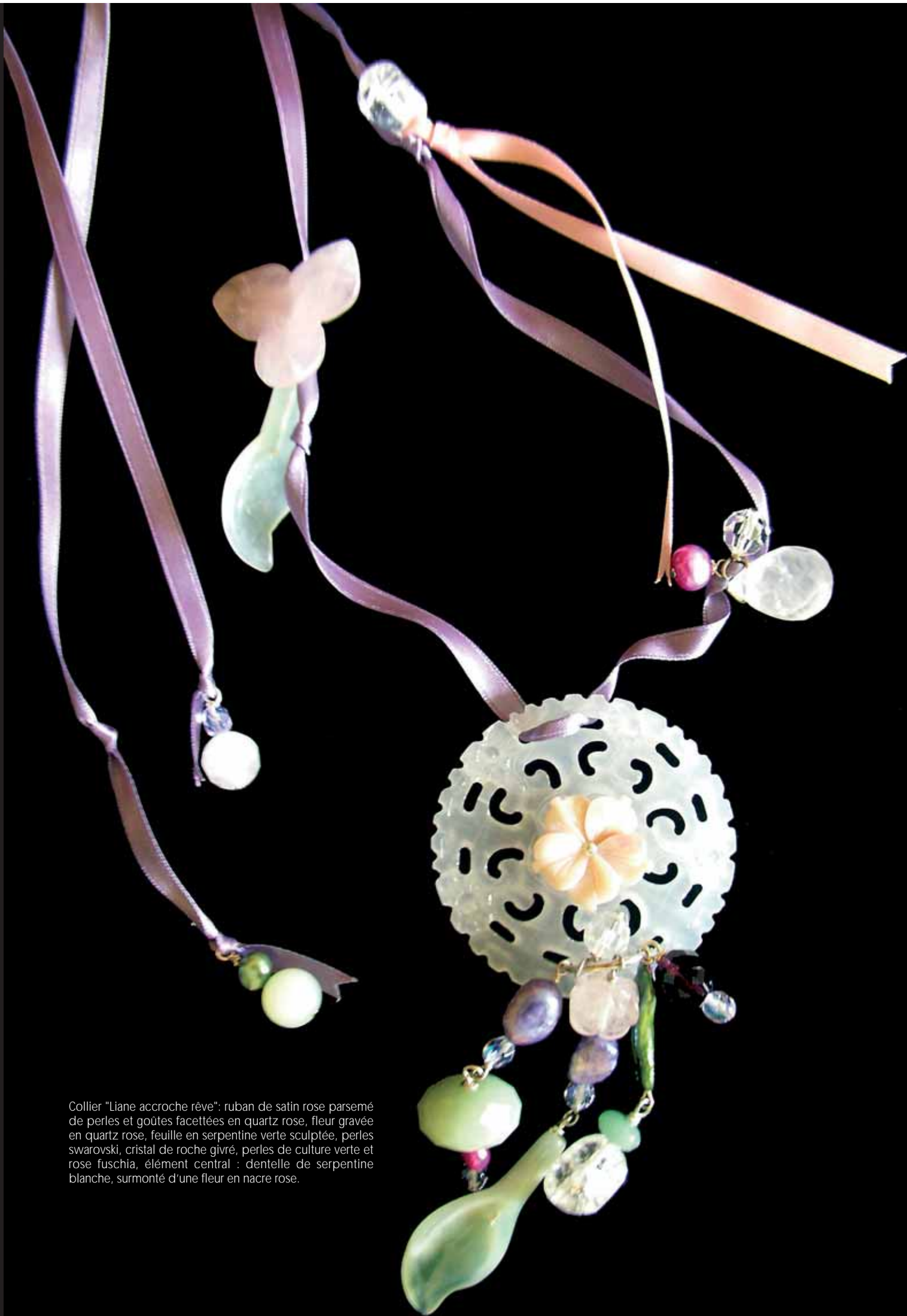
Collier "Liane accroche rêve": ruban de satin rose parsemé de perles et gouttes facettées en quartz rose, fleur gravée en quartz rose, feuille en serpentine verte sculptée, perles swarovski, cristal de roche givré, perles de culture verte et rose fuschia, élément central : dentelle de serpentine blanche, surmonté d'une fleur en nacre rose.